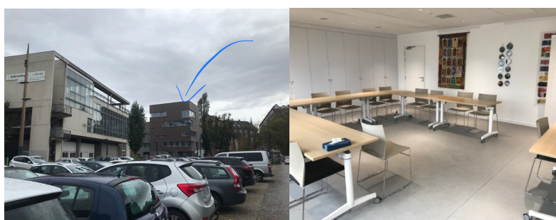
Maison des personnels.

Durant cette journée dédiée à la vie du SAGE, le laboratoire a réservé 4 belles salles de réunion (dont une double que l'on peut séparer), toutes situées sur un même étage de la Maison des Personnels de l'Unistra : l'occasion pour chaque axe de se réunir, tout en ayant la possibilité d'interagir avec les autres axes au besoin. La maison des personnels est située à 7 minutes à pied de la Manufacture.