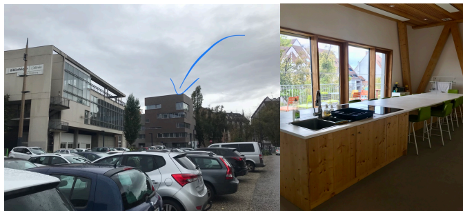
Maison des personnels.